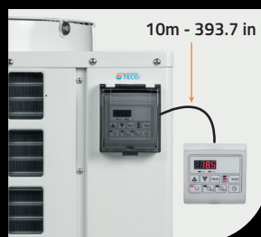
Controllo remoto / Remote Control