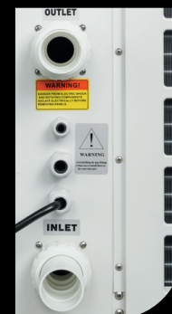
Giunti Acqua Water Joints